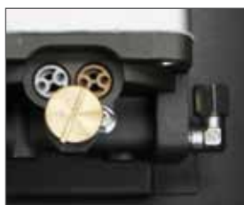
Force Vannes de régulation