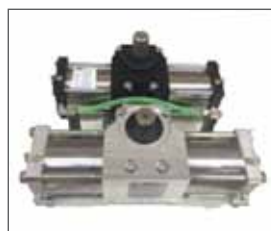
Dimensions actuateur Compact et Super