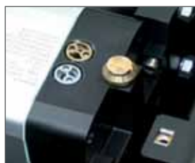
Vis réglage ralentissement hydraulique