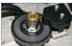
Mechanical twin-disc clutch (only for SATURN OIL)

Les versions SATURN OIL ont une lubrification des engrenages à huile pour une longévité maximale