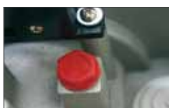
The SATURN OIL versions are with oil lubrication of the gears for max duration

Déverrouillage avec levier en aluminium et serrure