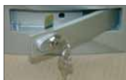
Release with aluminium lever and lock

Déverrouillage avec levier en aluminium et serrure