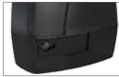
Special cataphoresis treatment (400 - 600 - 800 versions) Traitement cataphorèse spécial (versions 400- 600 et 800)