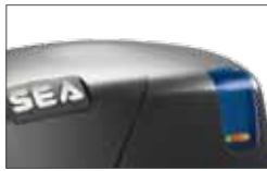
Possibility of LED light application on all models (optional) Led sur tous les modèles pour la signalisation du mouvement (en option)