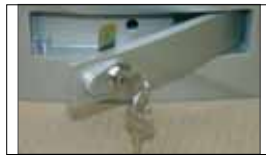
Release system through metal lock Déverrouillage avec serrure en métal