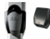
HTLOCKP Metal release PLUS with DIN lock for max. safety and joint