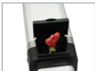
Système de déverrouillage et clé personnalisée SEA