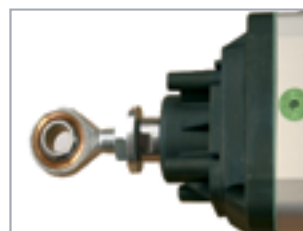
Joint à rotule pour réglage de la course