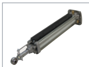
Encodeur absolute linéaire (optionnel)