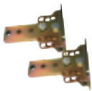
Attache postérieure réglable à visser (2 pièces)