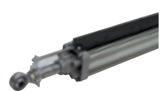
Encodeur absolute linéaire avec extrusion