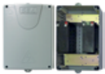
Kit batteries avec boîte