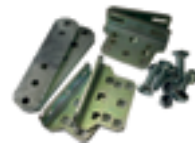
Etrier attaches arrières réglable sans soudure (2 pièces)