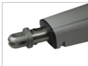
Attaque à l'extrémité à visser ou à souder

▶ Robuste opérateur électromécanique réalisé dans une coque en aluminium