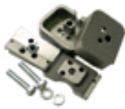
Butées mécaniques en fermeture (2 pcs)