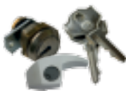
Cylindre DIN avec cryptage variable (1 pc)