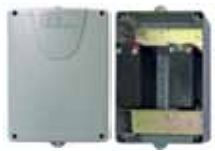
Kit batteries avec boîte