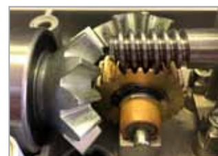
Engrenages et coussinets