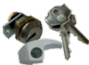
Cylindre DIN avec cryptage variable (1 pc)