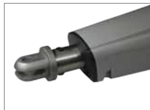
Attaque à l'extrémité à visser ou à souder