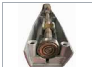
Robuste vis sans fin