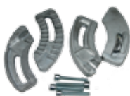
Kit fins de course mécaniques pour 1 moteur DOUBLE 24V BASIC