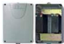
Kit batteries avec boîte