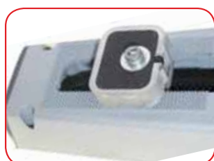
Butées mécaniques/ électroniques (de série sur version H)