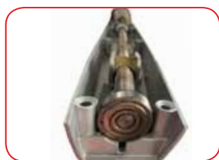
Robuste vis sans fin