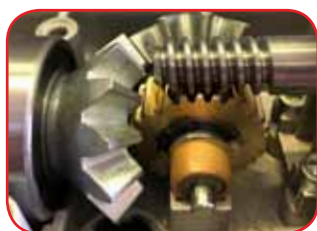
Engrenages et coussinets