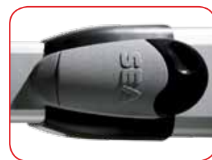
Système de déverrouillage PLUS en metal (optionnel pour HALF TANK 270)