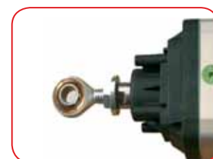
Joint à rotule pour réglage de la course