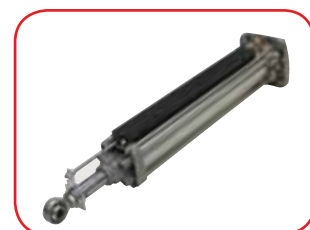
Encodeur absolute linéaire (de serie)