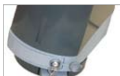
Sistema di sblocco tramite leva di alluminio e serratura metallica (di serie nel kit PLUS).