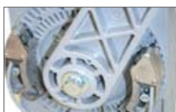
Finecorsa meccanici ed elettronici regolabili in apertura e chiusura. (di serie su FLIPPER PLUS)