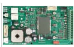
Centrale USER 1 - 24V DG programmabile con display a LED e luce di segnalazione integrati.