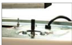
Inserimento motore ad innesto rapido su nuova guida catena unica in acciaio (CORONA RP)