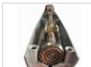
Robuste vis sans fin