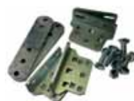
Etrier attaches arrières réglable sans soudure (2 pièces)