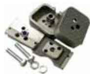
Butées mécaniques en fermeture (2 pcs)