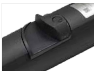
Serrure en métal pour déverrouillage manuel (de série sur version H)