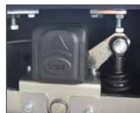
Encodeur Absolu RT