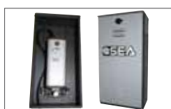
Galvanized steel and polyester painted box (included)

Caisson en acier galvanisé et peinture polyester (inclus)