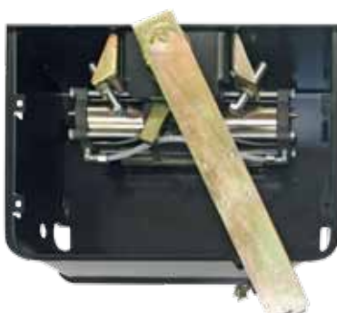
Jack 800 CP (with carrying box)