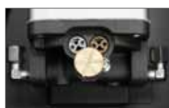
Strength control valves