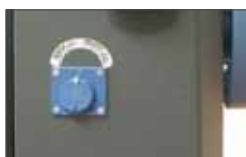
Easy to use release system with key in case of power failure Déverrouillage à clé facile à utiliser en cas de coupure de courant