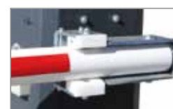
On request quick release