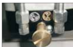
By pass valves