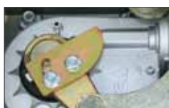
Adjustable mechanical stop in opening and closing Butées mécaniques réglables dans les deux directions