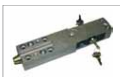
Plus release with lever and security lock Déverrouillage Plus avec levier et serrure de sécurité