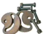
12715210 PSFO Mechanical stops in opening for FIELD DOUBLE Butée mécanique en ouverture pour FIELD DOUBLE n.2 pz