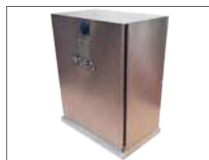
Caisson en acier inoxydable (optionnel)