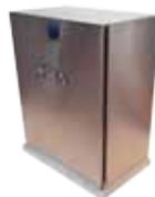
Caisson en acier inoxydable (optionnel)