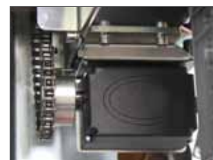
Encoder absolute RT