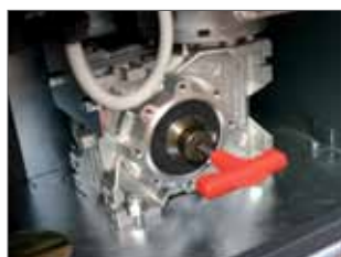
Déverrouillage avec clé personnalisée