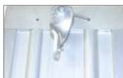
Sistema di sblocco tramite leva posta sull'attuatore con cavo.