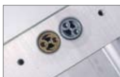
Sicurezza antisciacciamento grazie alle valvole by pass di taratura della forza.