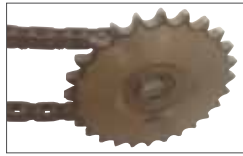
On request chain driven