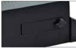
Release with metal lever DIN lock, and lock cover

Déverrouillage par un levier accessible par une trappe avec serrature DIN