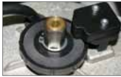
Mechanical twin-disc clutch

Déverrouillage par un levier accessible par une trappe avec serrature DIN