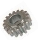
16101021* Pinion Z 16 double module 4 Pignon Z16 double module 4