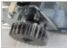
Pinion Z 24 module 4 Pignon Z24 module 4