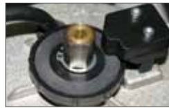
Mechanical twin-disc clutch Embrayage mécanique bi-disque