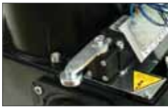
Mechanical limit switch with lever Fin de course mécanique à levier de haute qualité