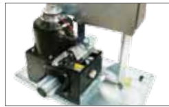
Internal photo Photo de l'intérieur