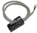
23101125 Safety microswitch kit on the door Kit Microswitch de sécurité sur la porte