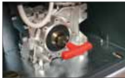
Release with personalized key Déverrouillage avec clé personnalisée