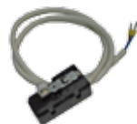
23101125 Safety microswitch kit on the door Kit Microswitch de sécurité sur la porte