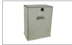
Stainless steel cover (option) Caisson en acier inoxydable (optionnel)