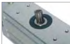
SCUTI M version with internal shaft on request

Sécurité anti-écrasement grâce aux valves by-pass de réglage de la force.