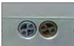
Anti-crushing security thanks to the force adjusting by-pass valves

Sécurité anti-écrasement grâce aux valves by-pass de réglage de la force.