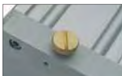
Manual, internal release system. Optional external release with customized key Système de déverrouillage interne manuel. En option déverrouillage extérieur avec clé personnalisée.