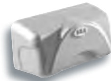
12711055 KOMEGA Carter Carter