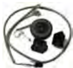
11303005 ENCOM KIT Encoder Encodeur