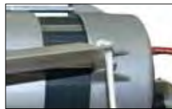
Release system with lever on the operator with cable.

Système de déverrouillage avec levier sur l'opérateur et câble