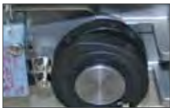
Electronic limit switches