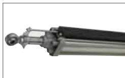
POSITION GATE Linear Encoder (optional) Encodeur linéaire (optionnel)

On request versions with hydraulic slowdown for a smooth approach of the leaves in closing Sur demande versions avec ralentissement hydraulique pour un accostage doux des vantaux en fermeture