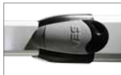
Metal release system PLUS with lock (optional for 270 stroke) Système de déverrouillage PLUS en métal (en option pour version 270)