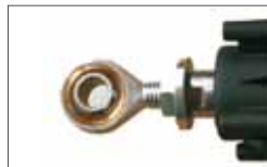
Round joint for stroke management Joint à rotule pour réglage de la tige