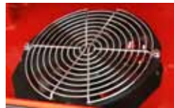
Optional cooling fan Ventilateur de refroidissement en option