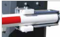
Quick release Sur demande déverrouillage rapide