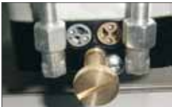
By pass valves Valves by-pass