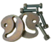
12715210 PSFO Mechanical stops in opening for FIELD DOUBLE Butée mécanique en ouverture pour FIELD DOUBLE n.2 pz