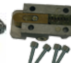
12710270 LOCKINTS Basic release Déverrouillage de base