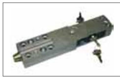
Plus release with lever and security lock Déverrouillage Plus avec levier et serrure de sécurité