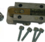
12710270 LOCKINTS Basic release Déverrouillage de base