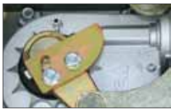
Adjustable mechanical stop in opening and closing Butées mécaniques réglables dans les deux directions