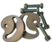
12715210 PSFO Mechanical stops in opening for FIELD DOUBLE Butée mécanique en ouverture pour FIELD DOUBLE n.2 pz