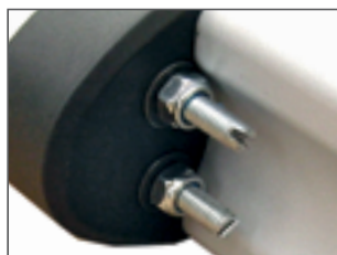
Fins de course électroniques réglables sur l'opérateur