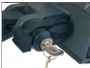
Déverrouillage avec clé (en option)